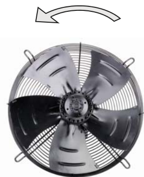
Sens de rotation - B