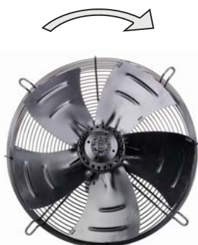
Sens de rotation - A