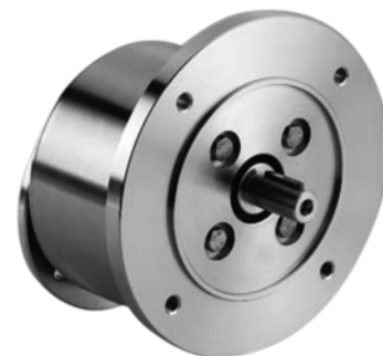
Réducteur Inox coaxial